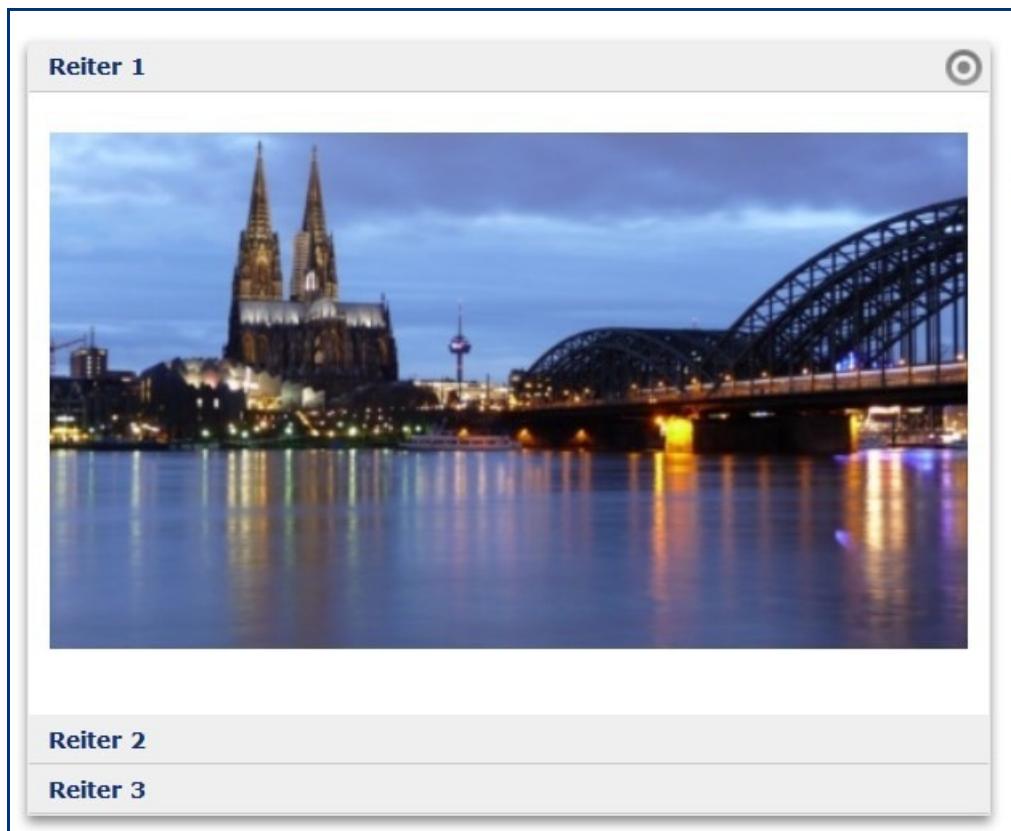
Reiterelement in vertikaler Darstellung als Akkordeon