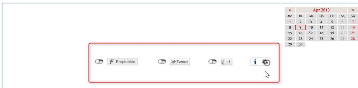
Abbildung 1: Social Network Links im Fußbereich der mittleren Spalte

Das Aussehen der Link-Leiste ändert sich mit ihrem Standort auf der Webseite, je nach Spaltenbereich sieht sie wie nachfolgend aus (in deaktiviertem Zustand):