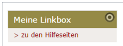
Abbildung 1: Die Linkbox im rechten Spaltenbereich

Wählen Sie über den Zauberstab ein Element vom Inhaltstyp Linkbox und platzieren diesen auf den von Ihnen ausgewählten Platz in der Seite.