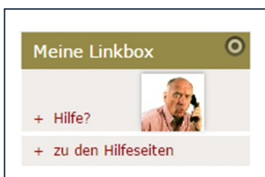
Abbildung 3: Linkbox mit Bild

Tragen Sie einen Titel für das Element ein, er kann auch als Box-Titel angezeigt werden. Geben Sie für jeden Link eine URL (entweder eine Seite über das Ordner-Symbol auswählen oder eine URL nach dem System http://www.meineurl.de angeben) und einen Link-Text an. Zudem können Sie jeweils entscheiden, ob der Link in einem neuen Fenster geöffnet werden soll.